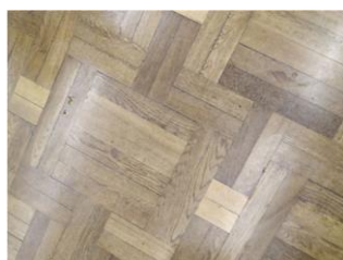
Parquet de la salle des professeurs

C'est un motif complexe composé de quatre petits carrés et entourés par des bandes plus grandes. Cette salle était un parloir.