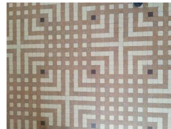
Mosaïque au sol du réfectoire

Il est fait par Labouret et représente un motif géométrique complexe. Sur les murs on voit une véritable fresque, ce qui montre le désir de faire un véritable « palais pour l'éducation ».