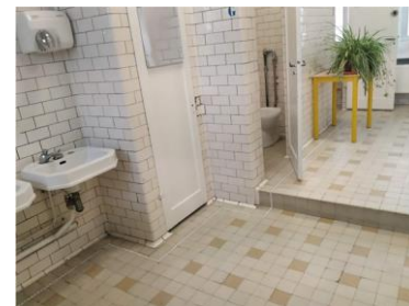
Sanitaire du 3 ème étage

Le carrelage des sanitaires a été conçu par Emile Labouret. Il est fait de formes simples aux couleurs blanches et ocre.